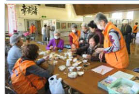
女性リーダーによる体験コーナー