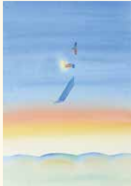
《見知らぬ人》1991年、水彩 フォロン財団蔵

20世紀後半のベルギーを代表するアーティストのひとり、ジャン=ミッシェル・フォロン(1934-2005)。彼の初期のドローイングや水彩画、版画、ポスター、立体作品など約230点を紹介する、日本では30年ぶりの大回顧展。