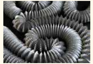
《シルバー・スネーク》 2024年 洋紙(ハイピカE2F) 作家蔵 ©Fuse Tomoko

折り紙作家の布施知子(-1951)の初期から2024年最新作まで約50点をご紹介します。