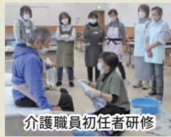
介護職員初任者研修