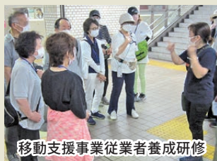
移動支援事業従業者養成研修