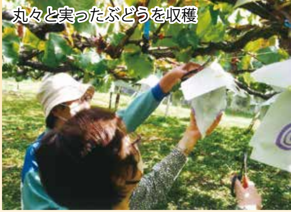
丸々と実ったぶどうを収穫