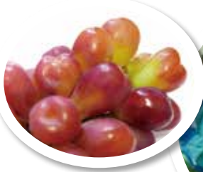
マイハート ※参考資料

ご近所の有志総勢35名で昨年9月、駒立ぶどう狩りに行きました。出発してフイワイお話をしている間に40分程で到着です。まず、説明があり、「袋