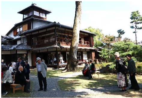
旧三井家 下鴨別邸

バスの中では、フレイル予防となるお口の体操を研修し、ハッ橋のお店やサービスエリアではたくさんのお土産を買い求め、帰りのバスは皆さん満足げな雰囲気でした。