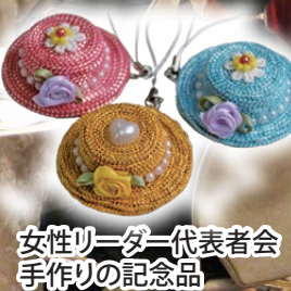
女性リーダー代表者会 手作りの記念品

7月6日・7日の両日にわた り、令和5年度東海・北陸ブロッ ク老人クラブリーダー研修会が 名古屋カールデンパレスにて、開 催されました。本年度の主催は、 名古屋市老連と全老連です。研 修会にはブロック内のリーダー 170名が参加。「のぼさう! 健康寿命、抱おう! 地域づく りを」の理念のもと、久しぶり に多くの仲間が集い、笑顔があ ふれていました。