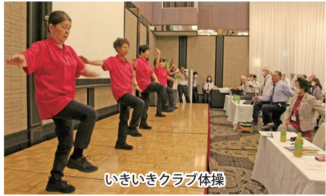
いきいきクラブ体操