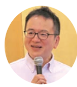
括ケアシステムに おける老人クラブ の役割」をテーマ

長による基調報告があり、高齢 者を取り巻く状況やクラブの現 状を具体的な数値で示し、今後 の取り組みを解説しました。ま た昨年11月8日に天皇皇后両陛 下をお迎えし、東京・両国国技 館において、全老連創立60周年 記念「全国老人クラブ大会」が 開催されたことを報告。天皇陛 下より賜った「おことば」も披 露しました。