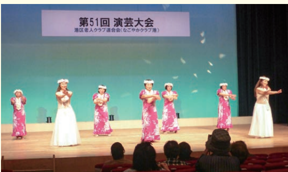
第51回 演芸大会 港区老人クラブ連合会(なごやかクラブ連)

11月8日の演芸大会は港文化小劇場で、声出し禁止で日舞2組、民謡踊り3組、歌謡舞踊、大正琴、フラダンス、そして銭太鼓と9チーム54名の熱演で華やかな舞台に100余名の観衆は大満足でした。