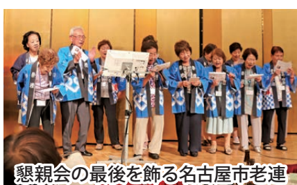
懇親会の最後を飾る名古屋市老連