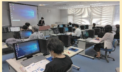
「はじめてさわるパソコン」