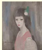
マリー・ローランサン(わたしの肖像)1924年 油彩/キャンヴァス マリー・ローランサン美術館

本展では、ともに1883年に生まれたマリー・ローランサンとココ・シャネルの二人の活躍を軸に、華やかで自由な雰囲気のある1920年代のパリで、美術とファッションが互いの境界を越えてダイナミックに展開していく様子をたどります。