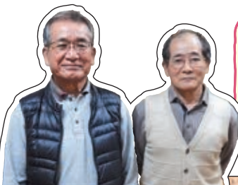
会長たちのひとこと

地域の繋がりの中でサロン活動を進めてきました。活動の中で知り合いが増え、近所の方とお話する機会が増えたという声もききます。このサロンを続けてきて良かったと思います。