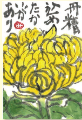
画/加藤 みち子 (東区古出来恵比寿会)

名古屋市老人クラブ連合会では、こちらに掲載させていただき挿絵を募集しています。投稿先は左下「投稿についてのお知らせ」をご参照ください。