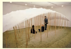
(Navigation Arch No.7) 1995年 ドリル・ホール・ギャラリー(キャンペラ)の展示風景

愛知県を拠点に50年以上活動を続ける作家・庄司達の個展。デビュー作である「白い布による空間」と「Navigation」の2つのシリーズをはじめ、約10点のインスタレーションを展示します。