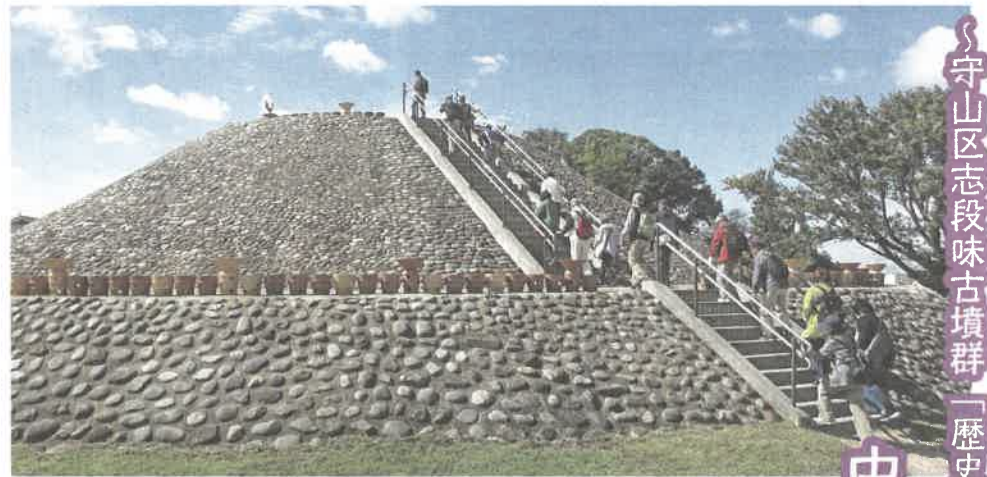
守山区志段味古墳群「歴史の里」めぐり

11月19日、市老連恒例の健康づくりウォーキング大会が千種区の東山公園一帯で開催されました。当日は晴天の下、肌寒くもなく、絶好のウォーキング日和となりました。例年、ウォーキングに出かける前に「いきいきクラブ体操」をして身体をほぐした後スタートしていましたが、コロナ禍で密を避けるため、今回は中止としました。受付を済ませた方から順次スタート。今回は930名の方が参加され、ウォーキングとともに紅葉真っ盛りの秋の景色を楽しまれていました。