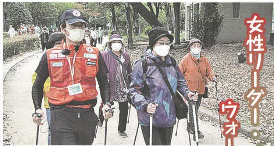
夕々の屋外活動、花と緑の名城公園で