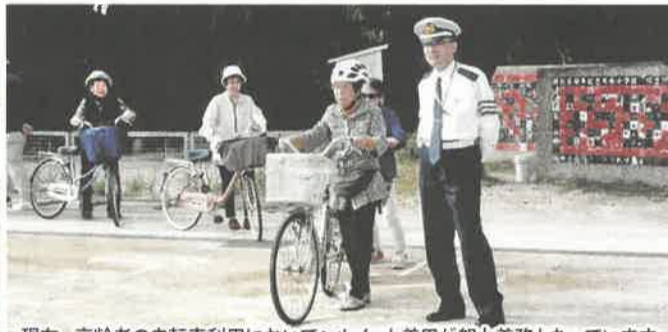
現在、高齢者の自転車利用においてヘルメット着用が努力義務となっています。

わが地区の老人クラブは、4クラブ150名が池場地区若鷺会と称して様々な集合行事を行っています。