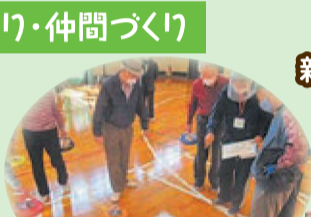
カローリング大会