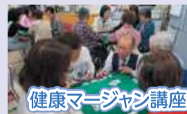
健康マージャン講座