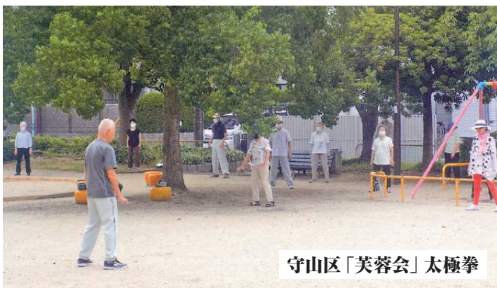
守山区「芙蓉会」太極拳