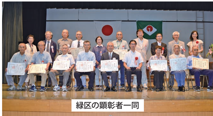
緑区の顕彰者一同

顕彰された方々は次のとおりです(敬称略) ※今年度は、老人クラブ大会が中止となったため、区老連を通じ、顕彰された方々に賞状と記念品をお渡ししました。