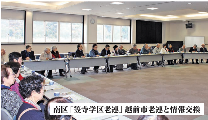
南区「笠寺学区老連」越前市老連と情報交換