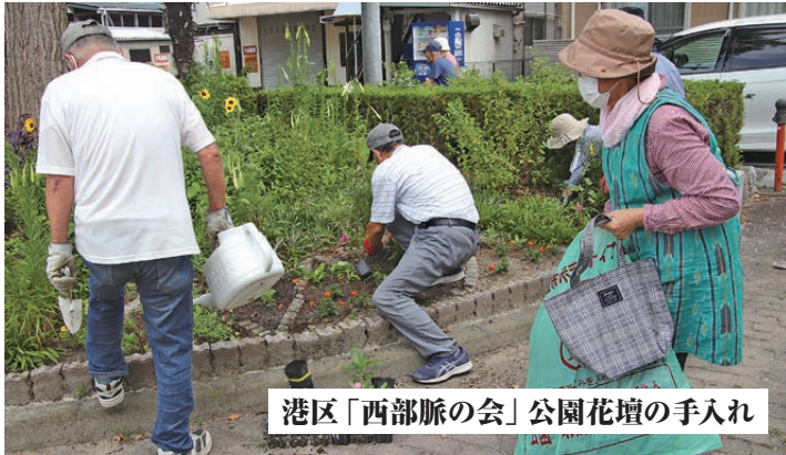
港区「西部脈の会」公園花壇の手入れ

守山区「芙蓉会」は、健康長寿を最重要事項として昭和54年から長期にわたりさまざまな活動を続けてきました。特に太極拳は、早朝の清掃活動・ラジオ体操の終了後、土日祝日関係なくほぼ毎日実施しています。これらの活動は、高齢者の健康維持と同時に、毎日顔を合わせるにより高齢者相互の見守りを行っています。