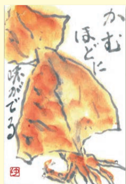
画/熊崎 幸江 (南区本城福寿会)

名古屋市老人クラブ連合会では、こちらに挿絵を募集しています。投稿先は左下「投稿についてのお知らせ」をご参照ください。