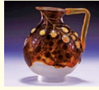
エミール・ガレ(葡萄酒水差し) 1900年頃

ロココからエコール・ド・パリまでの絵画や、エミール・ガレに代表されるアール・ヌーヴォーのガラス工芸、家具など、フランス美術300年が一望できる作品が一堂に会します。約180点の主要なコレクションをご鑑賞いただけます。