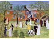
アンナ・マリア・ロバートソン・「グランマ・モーゼス(村の結婚式) 1951年 ベニントン美術館蔵 ©2021 Grandma Moses Properties Co., NY

無名の農婦からアメリカの国民的画家となったグランマ・モーゼスの生誕160年を機に特別企画された展覧会。たくましく101歳まで生きたモーゼスの作品・愛用品約130点を紹介。